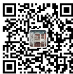
“北京大学外国语学院” 微信二维码

3. 请通过手机终端“微信 app”扫描下方二维码，将“北京大学外国语学院”加为微信好友。加好友时须发送： 专业+姓名+身份证号 ，方可通过验证。