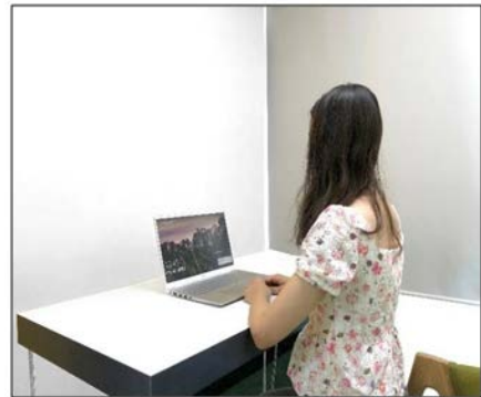
图3：侧后方第二机位效果图