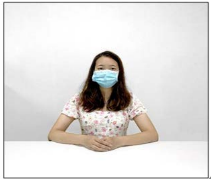
图2：正前方第一机位效果图